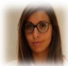
Consultante medias IDATE Montpellier