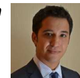
Consultant NPA Paris