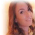
Responsable Editorial et Marketing Client SOGEC Marketing PARIS