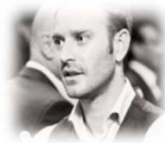
Responsable du Suivi Financier Télécom Société Générale Paris