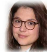
Phd Student in Economics Orange Paris