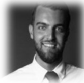
Software Engineering Montreal