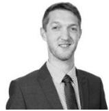
Project Manager FEDIL Business Luxembourg