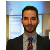
Advisor KPMG Luxembourg