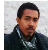
Analyste tarifaire TDF Marseille