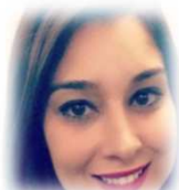
Customer Service Manager British Telecom PARIS