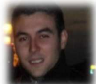
Conseiller financier Société Générale Paris