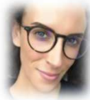
Digital Marketing Consultant Honk Kong