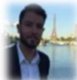
Business models analyst TowerCast Paris